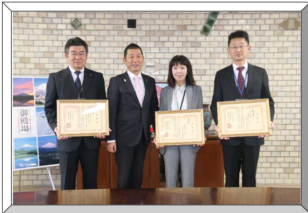
左から、子育て支援課長、若林市長、原里幼稚園長、学校教育課長 (11月16日市長公室にて)

御殿場市環境マネジメントシステムにおいて、他部署の模範となる優良な取り組みを行っている課等の表彰を行いました。