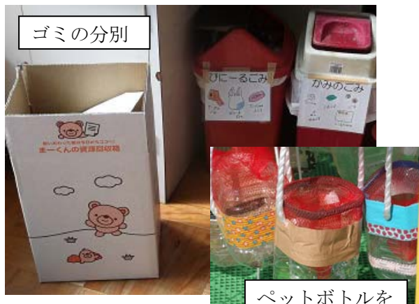
ペットボトルを 再利用した虫籠

教育の質と環境との両立を図るという、非常に難しい部署の中で、職員、子どもたち、保護者の関係者全員が高い環境意識を持って活動している。