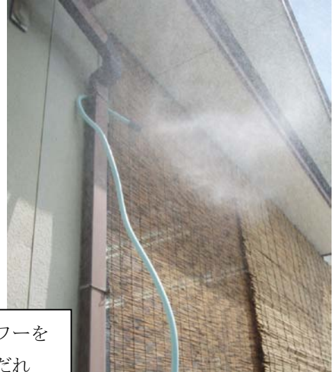
ミストシャワーを用いたすだれ

管理施設であるリサイクルセンターでは、8月より市直営施設では初めてのPPSを導入した。バイオ燃料を使用したCO2排出ゼロの業者を選定しており、市全体にとって大きな環境政策事例となっている。