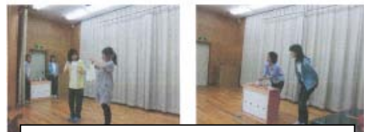
「もったいないばあさん」の寸劇