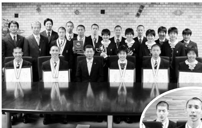
▲御殿場西高等学校空手道部の皆さん

までに、直接または電話で、環境課☎(82)1603へ 市民芸術祭「ほのぼのコンサート」参加団体募集 参加団体の各代表者全員で運営・実施にあたります。 日時／10月18日(日) 午後1時30分～ 場所／市民会館 大ホール 対象／文化協会加盟団体、市民及び市内に通勤・通学している人、市内で演奏活動をしている人 ※事前の打ち合わせ・リハーサルに参加し、当日の舞台運営に協力できる人 参加料／有り 申し込み・問い合わせ／6月19日(金)まで(当日必着)に、社会教育課と市役所各支所にある所定の申込用紙に必要事項を記入して、直接または郵送、ファクスで、〒412-8601 社会教育課内市民芸術祭実行委員会事務局☎(82)03399、FAX(81)0370へ 「中世を探る講座」受講生募集 日時／○講義…5月17日(日)、24日(日) 午後1時30分～3時30分、 ○史跡巡り…21日(木) 午前8時～午後5時 会場／○講義…図書館 2階会議室 ○史跡巡り…静岡市・焼津市方面 テーマ／「近世田畑検地帳地名と小字地名なにか」探る中世遺跡」 対象／市民